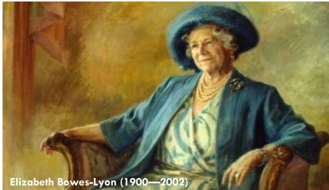
Elizabeth Bowes-Lyon (1900—2002)

Cuando los bombarderos de Hitler encendieron la noche con los trazadores, cuando Londres quemó, cuando los londinenses se acurrucaron en refugios, la noche finalmente vino cuando el palacio de Buckingham también fue golpeado.